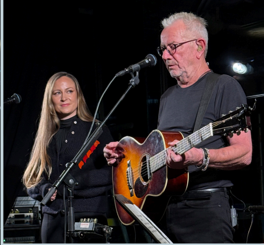
Åge Aleksandersen innledet med å si at det var 26 år siden han sist sto alene på scenen – han har hatt Sambandet i ryggen. Denne kvelden ble det en flott intimkonsert, der også datteren kom på scenen.

av virkeligheten. Når slike livshendelser deles som estetiske øyeblikk, kan det skape urealistiske forventninger til hvordan livet faktisk er. I realiteten er fødsel ofte smertefullt, kaotisk og uforutsigbart – og helt normalt nettopp derfor.